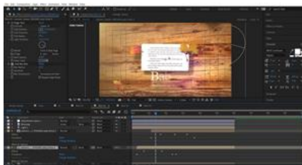
Gambar 2. Tahap Produksi

Selanjutnya dari tahap pra produksi langsung masuk kedalam tahap produksi merupakan tahapan yang mulai masuk untuk kedalam pembuatan karya, yaitu menggabungkan seluruh aset yang sudah di kumpulkan dan diatur sesuai dengan storyboard untuk dianimasikan.