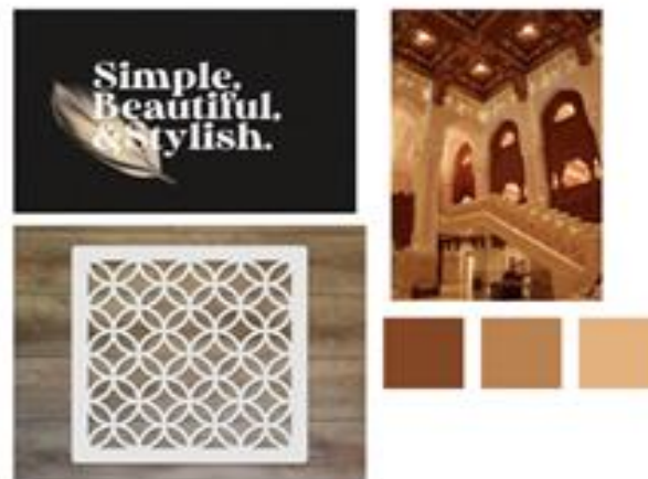
Gambar 1. Moodboard