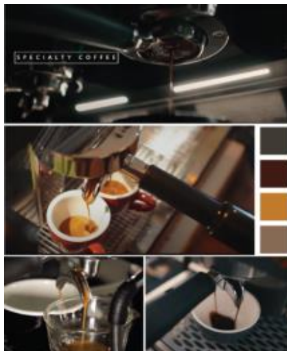
Gambar 1. Moodboard