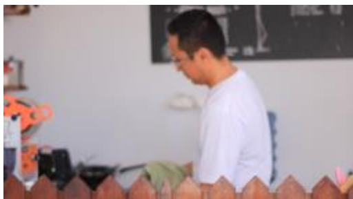
Gambar 2. Produksi

Pada tahap produksi penulis melakukan pengambilan video di lokasi yang sudah di tentukan dan pengambilan gambar yang sebelumnya sudah di rencanakan pada tahapan sebelumnya