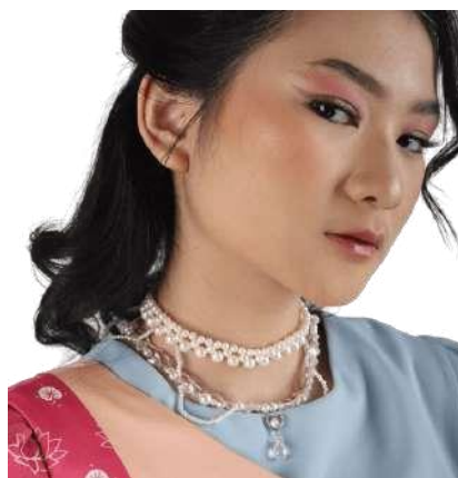
Gambar 3. 12 Kalung.