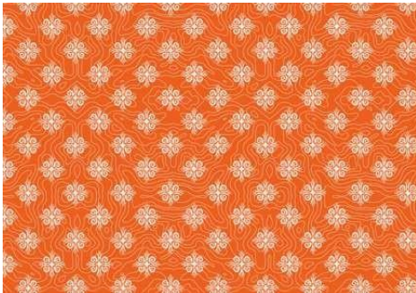
Gambar 16. Motif bunga lotus 1.