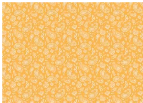
Gambar 18. Motif paisley .