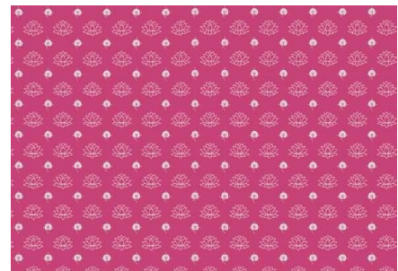
Gambar 17. Motif bunga lotus 2.