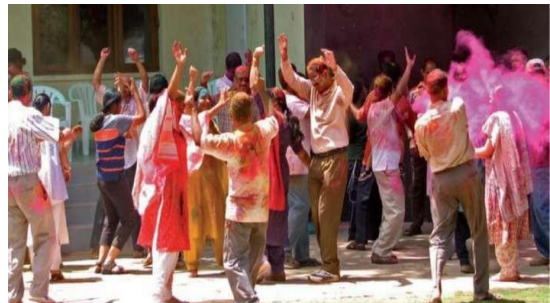
Gambar 2. Festival Dhuleti . (Guides, 2007: 327)

Festival Dhuleti merupakan salah satu acara di dalam festival Holi sebagai sarana bagi orang-orang untuk melampiaskan perasaan dari berbagai bagian dan melakukan relaksasi fisik. Pada perayaan ini, orang-orang saling mengolesi, melempar warna dan balon berisi air juga digunakan untuk bermain dan mewarnai satu sama lain yang melambangkan cinta seseorang untuk semua manusia. Siapa pun dapat melakukan permainan dengan adil, seperti teman atau orang asing, kaya atau miskin, pria atau wanita, anak-anak, dan orang tua. Bermain dengan warna dilakukan di jalan-jalan terbuka, taman, di luar kuil, dan bangunan. Parade ini sangat populer dengan nyanyian dan tarian. Setelah kerusuhan adu warna, orang-orang mandi, berdandan, dan mengunjungi teman dan keluarga.