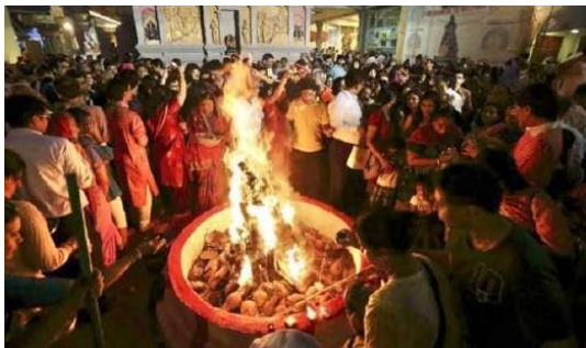
Gambar 1. Api unggun yang dinyalakan pada malam Holika dahan. (Miles, 2016: 15)

Holi biasanya dirayakan sehari setelah bulan purnama di bulan maret setiap tahun, di puncak peralihan dari musim dingin ke musim semi. Holi berlangsung selama dua hari utama, pertama pembakaran Holika yang disebut Holika Dahan atau Chhoti Holi , orang-orang berkumpul di persimpangan yang signifikan dan api unggun besar dinyalakan di pusat komunitas atau kuil. Abu yang Tersisa dari api unggun ini juga di anggap suci dan orang-orang mengoleskannya di dahi mereka yang dianggap dapat melindungi mereka dari kekuatan jahat, kemudian diikuti dengan hari kedua yang penuh warna dan menyenangkan, untuk menghormati Krishna. Keunikan dari festival Holi dimana orang-orang berkumpul untuk saling melempar serbuk berwarna sebagai bentuk keceriaan dan bersenang-senang ini sebagai inspirasi koleksi busana yang berjudul Alacer yang memiliki arti bersemangat dalam bahasa latin.