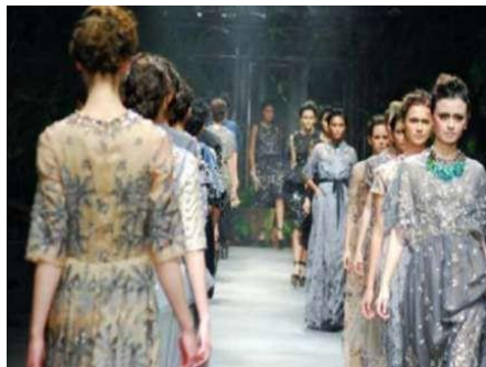
Gambar 4. Feminine style. (Midiani, 2015: 45)

Koleksi busana ini menggunakan tampilan folklore , dimana tampilan ini merupakan gaya pakaian yang terkait dengan pakaian daerah, pakaian nasional, pakaian tradisional, atau pakaian adat yang mengungkapkan identitas biasanya dikaitkan dengan wilayah geografis atau periode waktu dalam sejarah. Juga dapat menunjukkan status sosial, perkawinan atau agama. Busana tersebut digunakan untuk mewakili budaya atau identitas suatu suku bangsa tertentu. Kemudian gaya yang digunakan yaitu feminine merupakan gaya busana yang memiliki ciri khas tentang kelembutan yang mengusung konsep soft sehingga dalam pengaplikasiannya juga banyak menggunakan beragam warna yang lembut. Cenderung menyukai detail dekoratif seperti kerutan, renda, dan bunga-bunga. Bahan yang dipilih juga ringan seperti crepe, chiffon , silk, brukat, dan sutra. Wanita dengan gaya busana ini cenderung ramah, lemah lembut, dan penyayang.