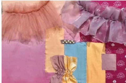
Gambar 10. Kolase bahan.

Kolase bahan merupakan kombinasi bahan yang terdapat pada koleksi busana Alacer . Kolase bahan terdiri dari empat jenis bahan yang digunakan. Bahan pertama menggunakan bahan toyobo yang dibuat dengan warna ungu. Bahan kedua yaitu menggunakan satin dengan tekstur yang halus dengan ketebalan yang sedang dengan motif gradasi, bunga lotus, dan paisley . Bahan ketiga yaitu organdi warna ungu dan gradasi oranye pink dengan tekstur yang lembut. Bahan keempat yaitu tulle sehingga menciptakan koleksi busana yang menarik.