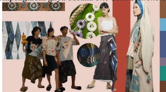
Gambar 5. The Soul Searchers, Rural, Fashion Trend 2023/2024 Co-Exist. (Midiani, 2022: 45)

Tren yang digunakan Koleksi busana mengacu pada Indonesia Trend Forecasting-Fashion Trend 2023/2024 Co-Exist . Menggunakan tema The Soul Searchers dengan sub tema Rural . Tema The Soul Searchers menggambarkan seseorang mencari keseimbangan emosi menjadi dambaan setelah lama terbebani oleh pekerjaan. Mencari ketenangan di tempat-tempat indah dan terpencil. Menikmati keindahan suasana alam di pedesaan, merasapi romantisme kesederhanaan penduduk lokal sungguh memberi rasa rileks dan damai. Menyatu dan bergembira bersama penduduk setempat mendatangkan inspirasi baru. Sedangkan sub tema Rural dibuat dengan kehangatan suasana dan keramahan penduduk setempat mempengaruhi gaya busana The Soul Searchers .