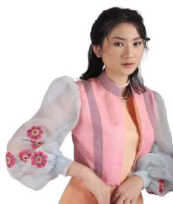
Gambar 11. Bordir bunga lotus.

Koleksi busana Alacer memiliki beberapa detail, yaitu bordir dengan motif bunga lotus dengan teknik jahit manual dan bordir dengan bentuk bunga warna pink, biru, dan kuning, kemudian terdapat pita pada bagian lengan yang membuat tampilan busana terkesan menarik pada saat digunakan.