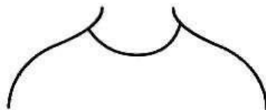
Gambar 8. Round neckline. (Fashionary, 2017: 148)

Round Neckline adalah leher bulat yaitu garis leher sederhana yang cocok untuk berbagai bentuk tubuh dan merupakan salah satu jenis garis leher yang paling umum. Leher bulat meminimalkan bagian dada yang terlihat dan ini memberikan kesan leher yang lebih pendek dan area dada yang lebih penuh. Seperti namanya, leher bulat adalah bentuk bulat yang sederhana dan dapat dikenakan oleh banyak orang. Garis leher ini sangat trendi dan biasa terlihat pada t-shirt dan pakaian lainnya.