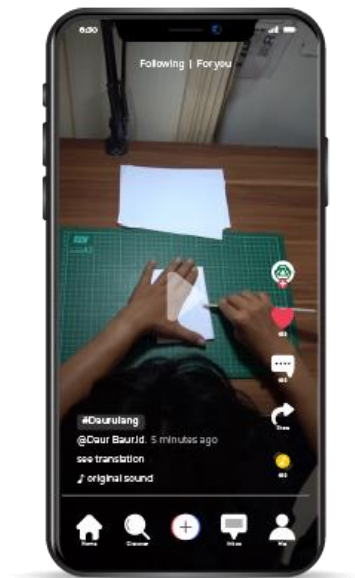
Gambar 2. Uraian Video Tiktok