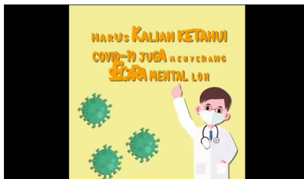
Gambar 2. Desain Motion Graphic 1

( https://drive.google.com/file/d/1DkuAIWQ0h7m6H3mbJzFO3FeJ7jXaTISR/view?usp=sharing )