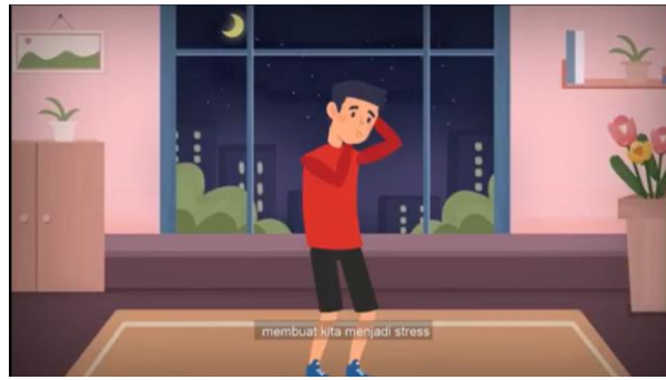
Gambar 3. Desain Motion Graphic 2