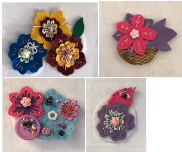
Gambar 5. Hasil Karya Santri

Berdasarkan kegiatan yang kami amati, setelah mengikuti workshop tersebut memang sangat disayangkan pemahaman santri mengenai fashion atau sebagai lainnya sangat kurang sekali, mulai dari pengetahuan sampai keterampilan pun masih sangat kurang menurut kesimpulan kami. Ini bisa dilihat dari pertanyaan yang mereka ajukan, serta dari interaksi 2 arah dari kami dan para santri yang miss communication pada saat penjelasan pemahan teori dan keterampilan.