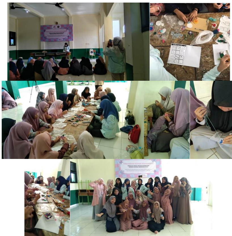
Gambar 4. Dokumentasi Kegiatan

Anggaran untuk kegiatan Pengabdian Masyarakat bersumber dari kolektif seluruh anggota tim sebesar Rp. 492.000,00. Dimana setiap anggota tim memberikan swadaya atau patungan sebesar Rp. 98.400,00.