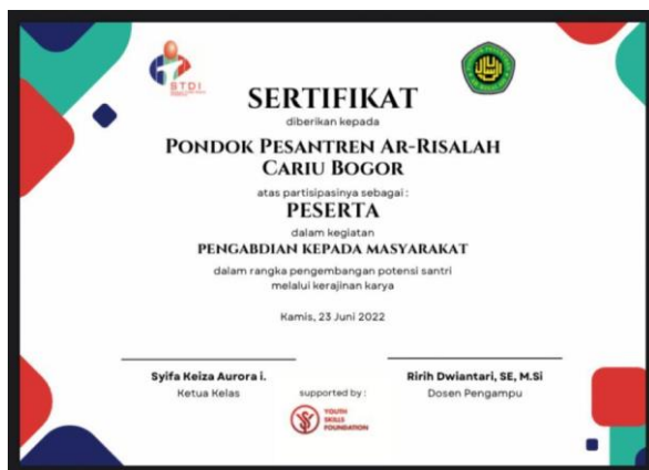
Gambar 4. Desain Sertifikat