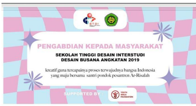
Gambar 3. Desain Banner