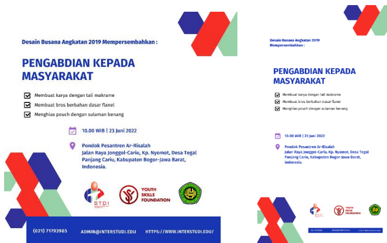
Gambar 2. Desain Flyer

Begitu juga dengan aksesoris yang biasa dikenakan untuk para santri yaitu bros. bros merupakan benda kecil penunjang penampilan, karena bisa digunakan sebagai hiasan saja maupun benda yang berguna untuk mengaitkan ke suatu busana maupun tas atau sepatu.